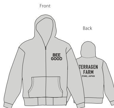
TF-ZH-001 BEE GOOD ジップフード サイズ：L / XL カラー：Grey