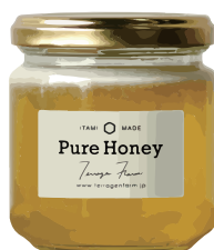
TF-LPH-210 PURE HONEY (瓶) 容量：210g