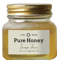
TF-LPH-110 PURE HONEY (瓶) 容量：110g

兵庫県伊丹市という都市部で採れたハチミツ。街中の公園や河川敷などに咲いた花からミツバチが集めてくれたハチミツは、優しい風味としっかりとした甘さが特徴です。Tシャツとフードも伊丹ローカルのプリント屋さんが作りました。畑作業や養蜂に使う道具ケースは熟練のレザー職人が作ってくれたアメリカ製。さらに今年は自ら畑に道具小屋を作ってしまった。テラゲンファームは代々続く家業を継ぎながら自由に農業と養蜂を楽しんでいます。日本の農業をローカルから世界に発信中！