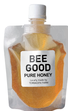
TF-BG-200 PURE HONEY "BEE GOOD" (スタンドパック) 容量：200g