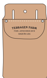
TF-HL-407X レザーツールケース W11xH18cm Made in U.S.A.